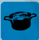
Olla de Cocción